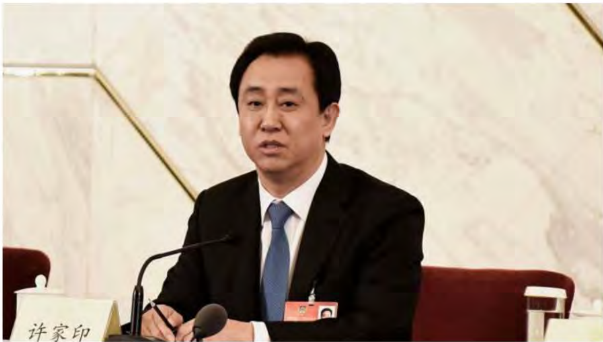
中國恆大集團董事局主席許家印。